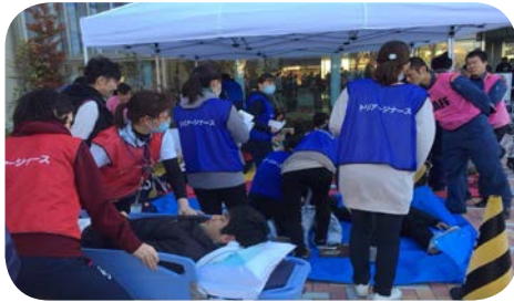
※訓練時のトリアージポストの様子

それでも毎年新たな課題が見つかり、災害拠点病院としての責務を果たすためにもさらなる訓練を重ねることが必要だと思いました。関係機関の連携を強め、災害時の限られた医療体制の中でも地域の安心安全を守ってまいります。