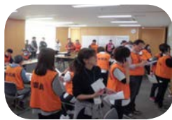
※訓練時の災害本部の様子