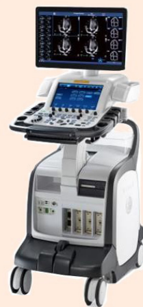
※ Vivid E90

2017年12月に導入された心臓超音波（心エコー）診断装置のご紹介をします。高画質表示と画像処理のリアルタイム性を両立したハイスペック診断装置です。画像が鮮明になったことでより精度の高い検査が行えるようになりました。