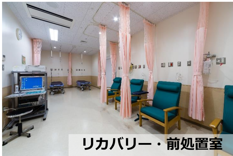
リカバリー・前処置室