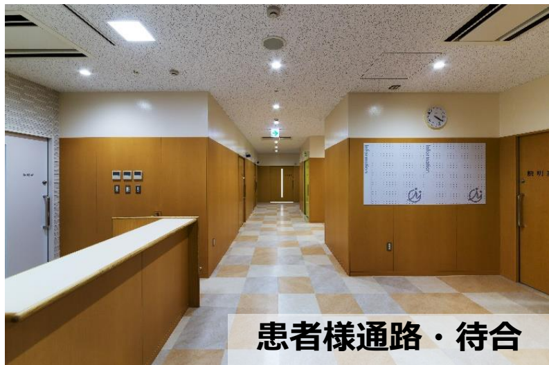
患者様通路・待合