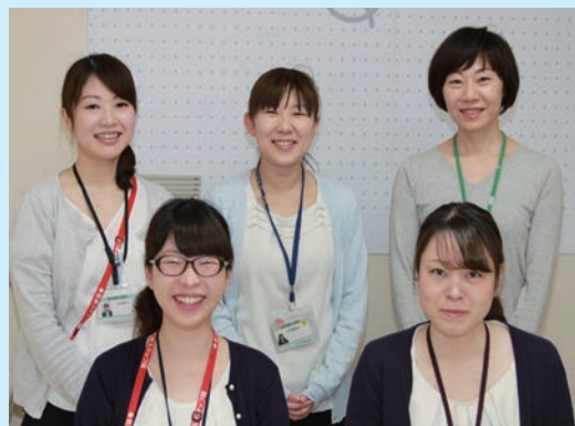
↑当院のソーシャルワーカーたちが安心して退院できるように支援をしていきます。

このような不安に対してソーシャルワーカーは、患者さん自身やご家族の話を聴き、一緒に問題を整理し、支援をしていきます。